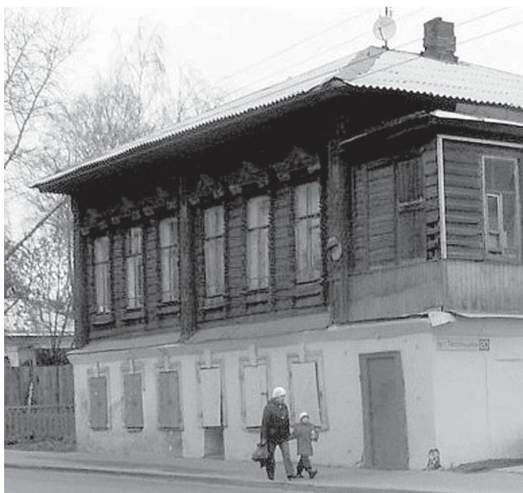
Дом Рязановских в Костроме.